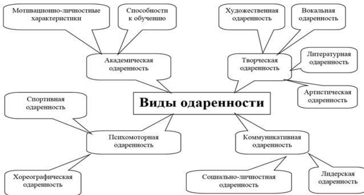
Схема №1. «Виды одаренности в зависимости от вида предпочитаемой деятельности».

Более подробно виды одаренности в зависимости от вида предпочитаемой деятельности показаны на схеме №1 и в таблице 2.